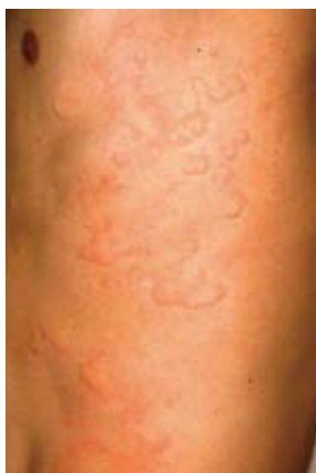
（図1）日本皮膚科学会 HP より

「じんま疹」であらわれる膨疹は2〜3mmの円形、楕円形のものから、直径10cm以上の地図状のものまでさまざまです（図1）。一ヶ所にできたかと思うと消え、また別の場所に出てくることもあります。